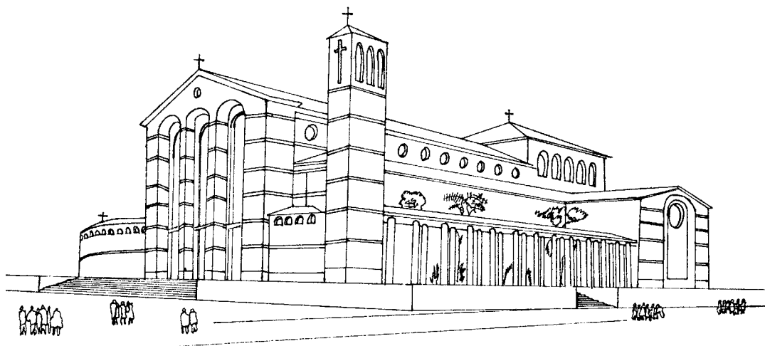
Proyecto de la Catedral, aparecido en el Diario La Mañana, de Talca, el 29 - X - 1939, p. ó.

ría. Del préstamo de la Corporación ya se ha gastado buena parte, queda un saldo de poco más de cien mil pesos.